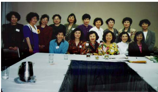
一九九五年NATWA第一次理事會 APRIL 20, 1995 於休士頓

十七年來從創會的四十餘人增加到超過千名會員，工作人員上百，NATWA 已成長壯大。回顧 NATWA 的歷史可說是北美洲臺灣婦女的自覺與認同，經由這個組織，北美洲臺灣婦女互相扶持鼓勵，共同成長。十七年來 NATWA 也培養不少領導人才，對北美洲社會及故鄉臺灣都有特殊的貢獻。