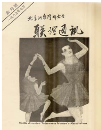
The first NATWA magazine- July, 1989