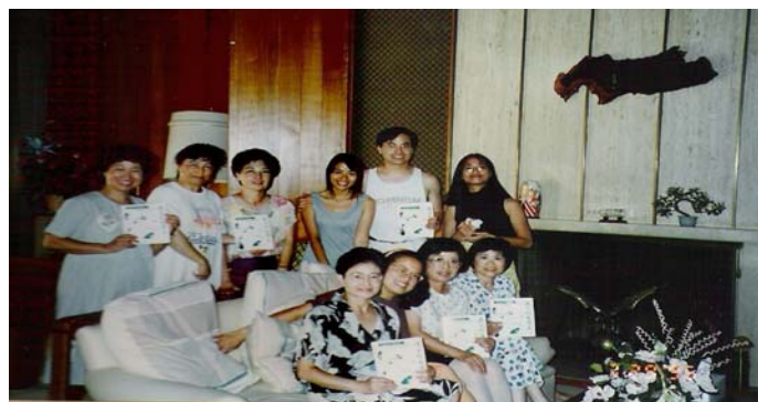
慶祝台灣菜食譜出版