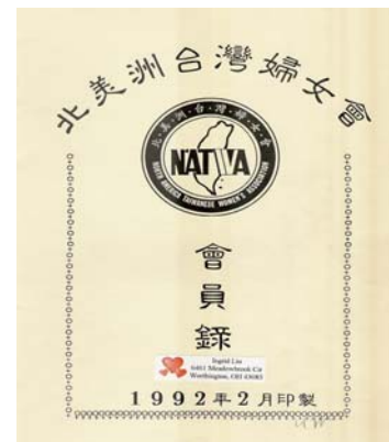
The first NATWA Directory (1992)