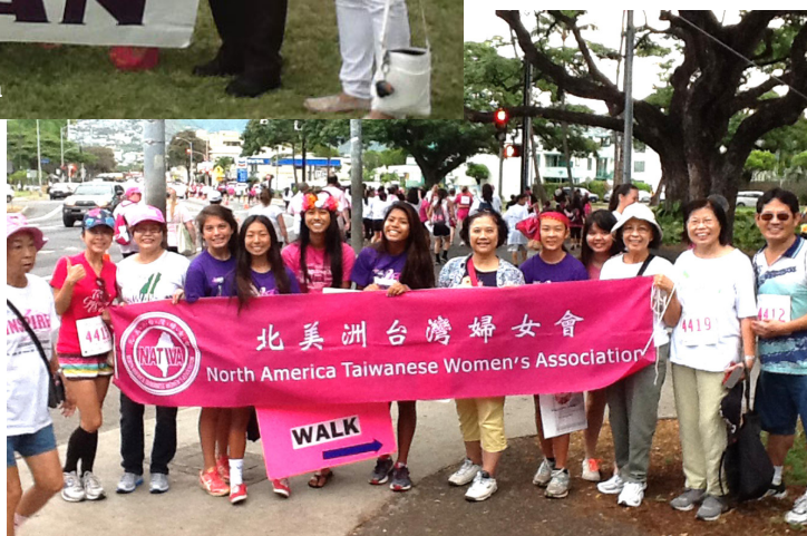
Race for the cure