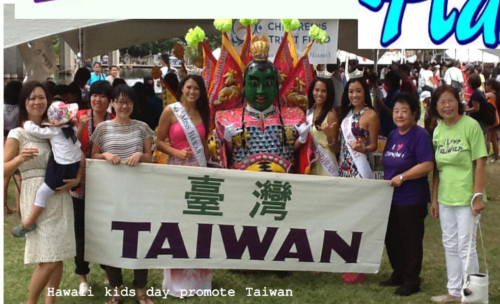
Hawaii kids day promote Taiwan