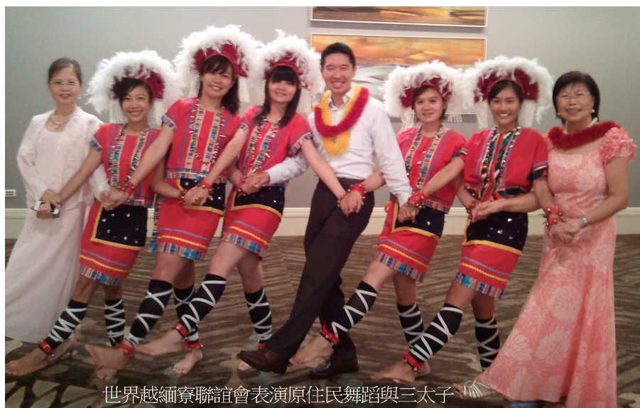
世界越緬寮聯誼會表演原住民舞蹈與三太子